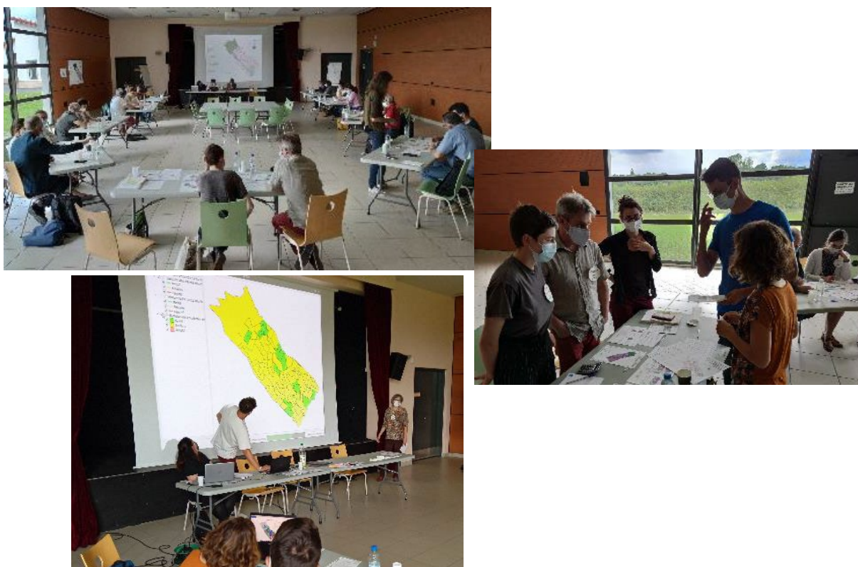
Figure 1 : Exemples de configuration du jeu CAUSERIE et de carte générée lors d'un tour de jeu

Le jeu est coordonné par un animateur qui organise les tours de jeu et nécessite la présence d'une personne en charge de faire tourner l'outil de SIG « GEOMELBA » générateur de cartes de potentiel de transfert ou d'atténuation des produits phytosanitaires (Figure 1). Les joueurs sont répartis en binôme, entre différents rôles : au maximum 7 profils d'agriculteurs, un acteur de la filière agricole (conseiller, agro-fournisseur) et un gestionnaire de bassin-versant . Un profil est associé à chaque binôme « agriculteur » : il détaille le parcellaire exploité, l'usage de ses sols, le linéaire et la nature des éléments paysagers présents, les systèmes de culture (assurantiel, optimisé, sans chimie de synthèse), un coût d'exploitation et un objectif de gestion ou d'évolution de l'exploitation.